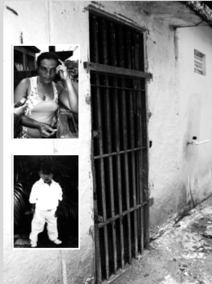
Mãe pede pelo filho. A grade do presídio foi presa com barra de ferro