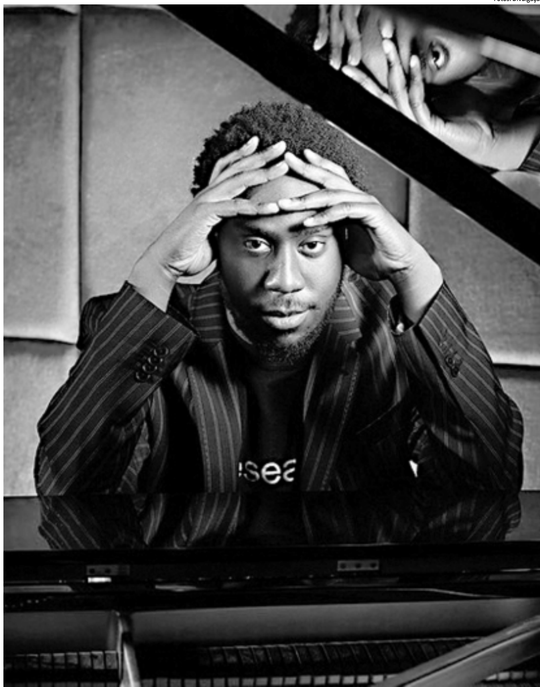
Robert Glasper tem uma visão modernista do jazz e aposta na fusão com outros gêneros

"Escolhi estes convidados porque já trabalhei com eles antes", explica o músico norte-americano. São nomes como Mos Def, Ledisi, Lupe Fiasco, Chrisette Michele e a diva Erykah Badu. "Ela costumava ficar próxima a mim lá no Brooklyn. Eu a conheço há anos", conta. Apesar da multiplicidade de talentos que permeiam