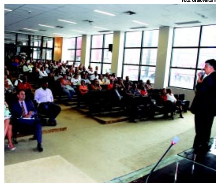
Foco da discussão iniciada ontem é a qualidade da alimentação

O Ministério Público Estadual promoveu debate sobre alimentação saudável nas escolas, ontem em João Pessoa. A intenção é prevenir a obesidade, que atinge cerca de 40% do alunado de escolas da rede privada de todo o país. Diretores de escolas e profissionais de saúde participaram. PÁGINA 11