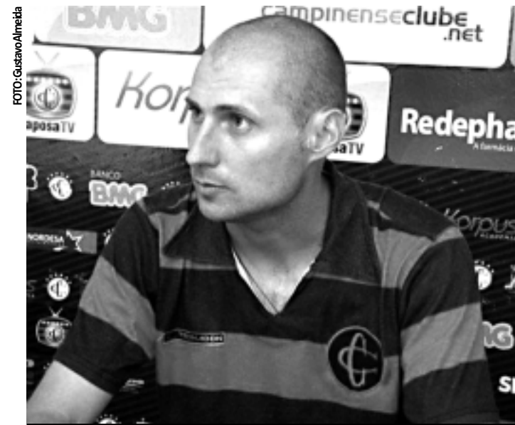
O lateral é mais um do futebol gaúcho a desembarcar em CG

Liderando a competição, com 17 pontos, o Campinense volta a jogar na quinta-feira, em João Pessoa, contra o Flamengo-PB, em partida válida pela 10ª rodada do Estadual.