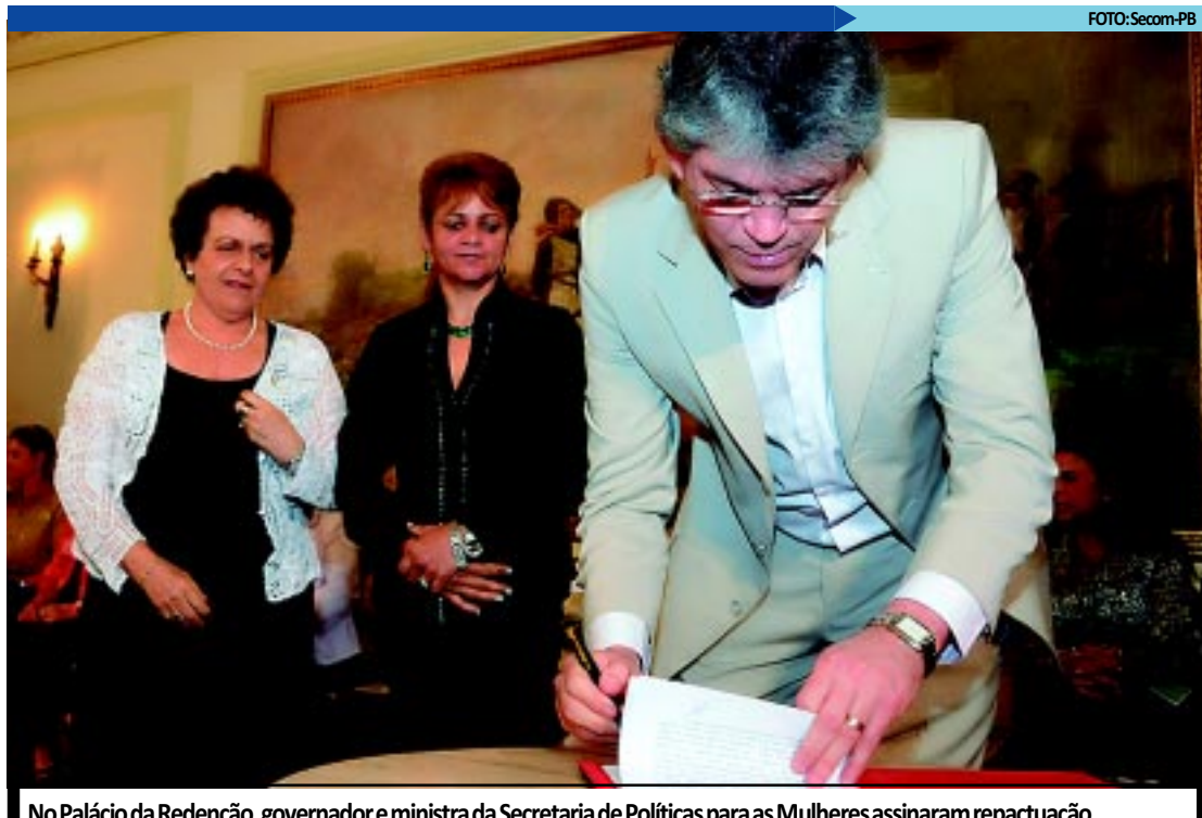
No Palácio da Redenção, governador e ministra da Secretaria de Políticas para as Mulheres assinaram repactuação

"Desde nossa posse, a Paraíba passou, verdadeiramente, a fazer política de gênero. Estamos cuidando de uma política pública que abrange diversas áreas, como a da violência e da saúde da mulher", acrescentou.