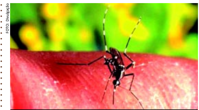
[FOTO&LEGENDA] A Secretaria de Estado da Saúde recebeu notificações de 424 casos suspeitos de dengue na PB, até o último dia 9. A proporção de confirmação dos casos está abaixo da proporção de descarte, em uma redução de 86% em relação ao mesmo período de 2011.