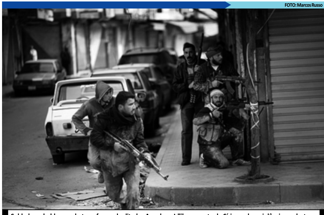
Soldados rebeldes combatem forças do ditador Assad em Idlib, no norte da Síria, onde a violência se alastra

Ontem, o presidente da comissão de investigação internacional sobre a Síria, o brasileiro Paulo Pinheiro, apresentou um informe em que relata a situação no país, sob conflito há mais de um ano. "O êxodo continua para o Líbano, a Jordânia e a Turquia. A situação desesperada dos civis deve ser tratada com urgência absoluta", afirmou Pinheiro, na exposição do documento.