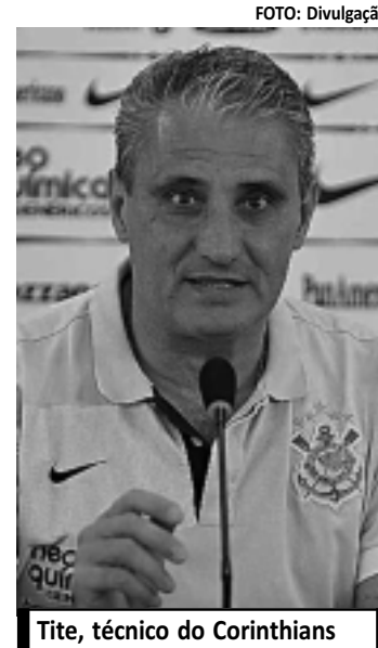
Tite, técnico do Corinthians

Agora, sem qualquer preparação especial, será que o resultado será diferente? É aguardar até o fim da partida.