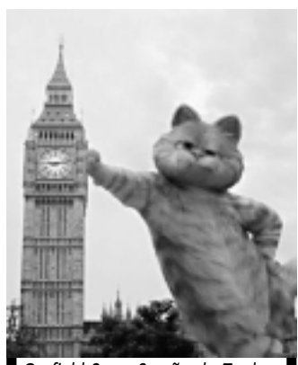
Garfield 2, na Sessão da Tarde

17h57 - Malhação 18h25 - Amor Eterno Amor 19h15 - JPB - 2ª Edição 19h30 - Aquele Beijo 20h30 - Jornal Nacional 21h05 - Fina Estampa 22h15 - Big Brother Brasil 12 23h30 - Louco por Elas 00h10 - Jornal da Globo 00h40 - Programa do Jô 02h10 - Hawaii Five0 03h00 - Coruja I