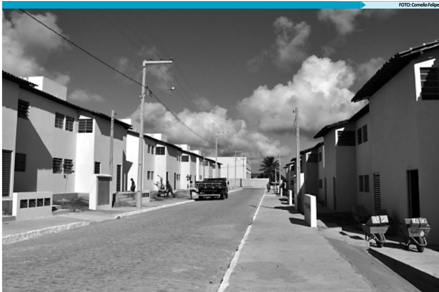
Hoje, serão atendidas 176 famílias que tiveram os apartamentos sorteados, na semana passada, para os residenciais I, II, VI e VII

Para amanhã pela manhã, está programado no anfiteatro recreação com os arte