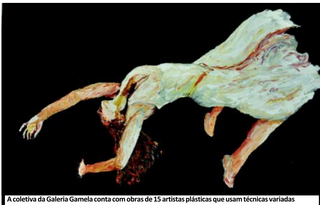
A coletiva da Galeria Gamela conta com obras de 15 artistas plásticas que usam técnicas variadas

Sob o título Artes Visuais: finalmente um mundo compartilhado, no texto de apresentação