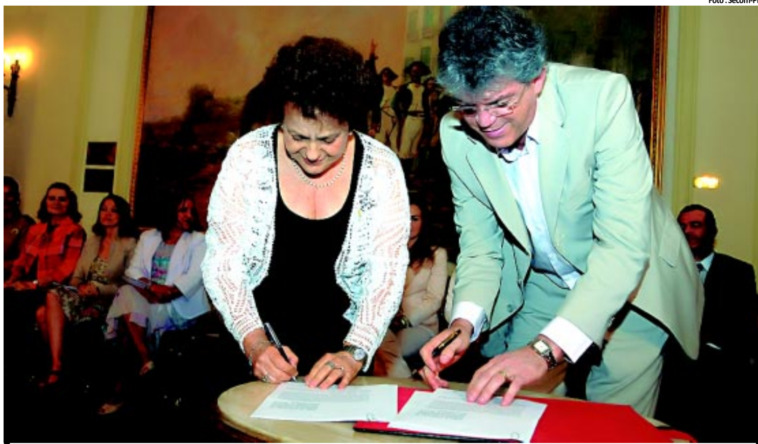
Ministra Menicucci destacou a eficiência da rede na Paraíba, durante assinatura do termo de cooperação com o governador do Estado

objetivo seria promover um 'rodízio' de líderes do governo, o que também deve acontecer na Câmara, com a saída do deputado Cândido Vaccarezza (PT-SP). PÁGINA 6