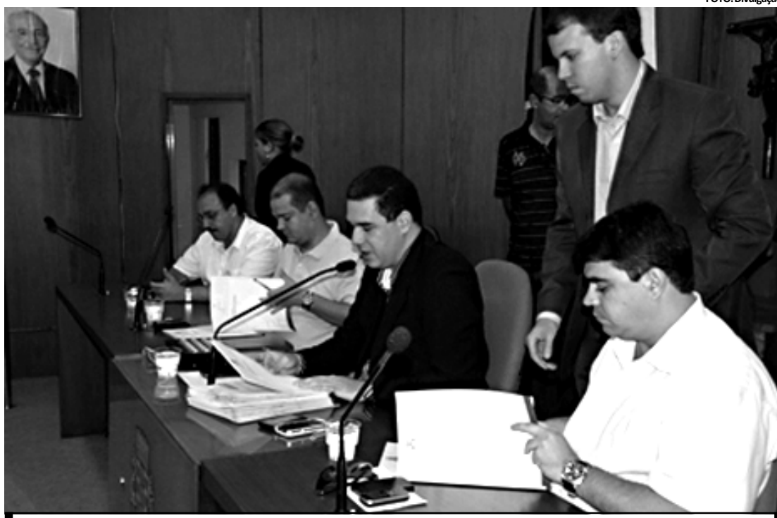
O dispositivo proibe ainda a publicação deste material em qualquer veículo de comunicação que circule na cidade

Serão examinados 59 processos, 27 deles referentes a pedidos de aposentadorias e pensões para servidores públicos ou seus dependentes.