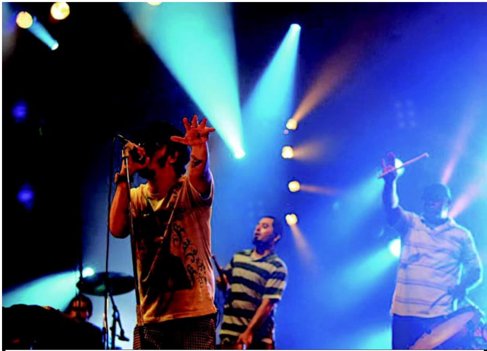
A banda pernambucana Nação Zumbi, que se revela melhor a cada disco, mostra toda a força de sua música em apresentações que atraem grande público