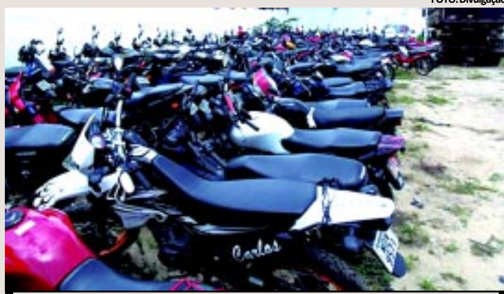
A grande maioria dos veículos apreendidos (66) foi de motocicletas

Segundo o Major, o objetivo das operações foi reduzir o índice de infrações e de acidentes de trânsito. "A CPTTran iniciou uma nova dinâmica de operações juntamente com o Comando Regional da Polícia Militar e do 2º BPM para buscar a segurança da sociedade campinense no que diz respeito ao trânsito", explicou. Segundo ele, já foram apreendi-