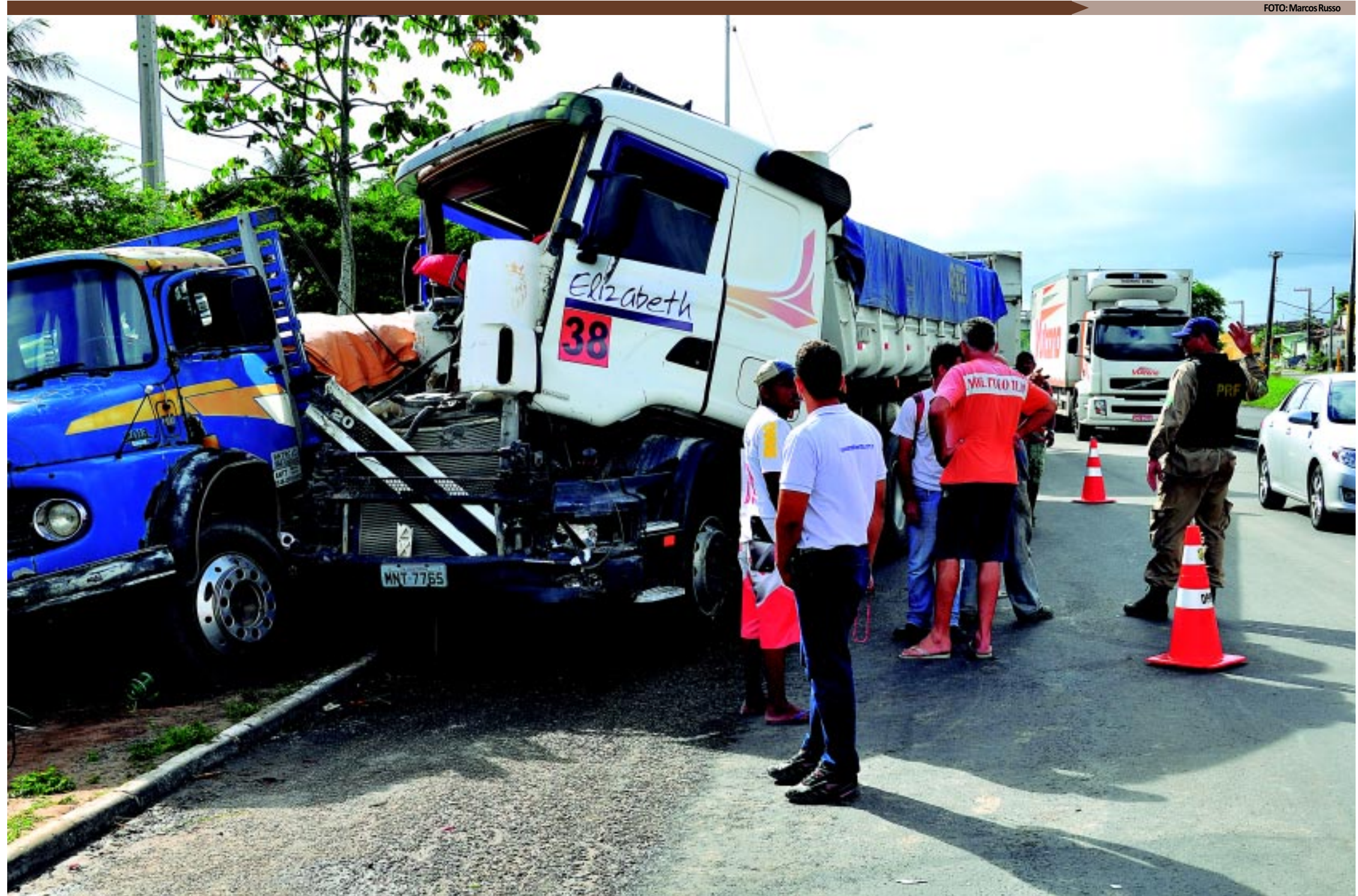
O trânsito ficou lento nas proximidades do quilômetro 32, da BR 230, após o acidente. O condutor da carreta disse que o freio do veículo falhou. Apesar do prejuízo material, os motoristas tiveram apenas ferimentos leves, segundo a PRF

João Pessoa > Paraíba > TERÇA-FEIRA, 13 de março de 2012