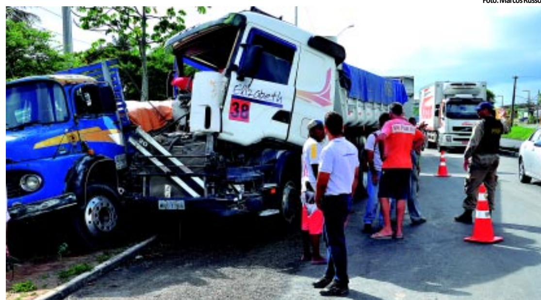
Motorista da carreta disse que os freios falharam e testemunhas afirmam que ele corria muito