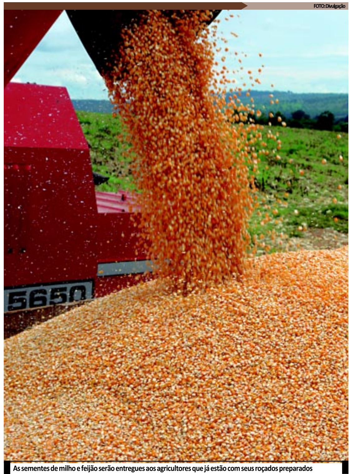
As sementes de milho e feijão serão entregues aos agricultores que já estão com seus roçados preparados

INCLUSÃO PRODUTIVA – A destinação de sementes é uma das ações do Plano Brasil Sem Miséria, coordenado pelo Ministério do Desenvolvimento Social e Combate à Fome (MDS), com foco na inclusão produtiva rural. O perfil dos beneficiários é de agricultores familiares extremamente pobres, povos e comunidades tradicionais, com renda mensal de até R$ 70 per capita. As famílias recebem recurso financeiro e assistência técnica continuada, coordenada pelo Ministério do Desenvolvimento Agrário (MDA). Para ter direito ao benefício, as famílias precisam estar registradas no Cadastro Único para Programas Sociais do Governo Federal.