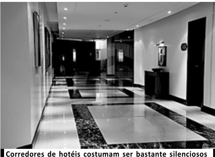
Corredores de hotéis costumam ser bastante silenciosos

Mas que tal, antes de dormir, ler um pouco naquela poltrona do corredor? Naquele silêncio profundo que faz a gente ouvir o próprio coração? Ah, o silêncio... como ele faz barulho dentro de nossa consciência. O barulho silencioso das ideias.